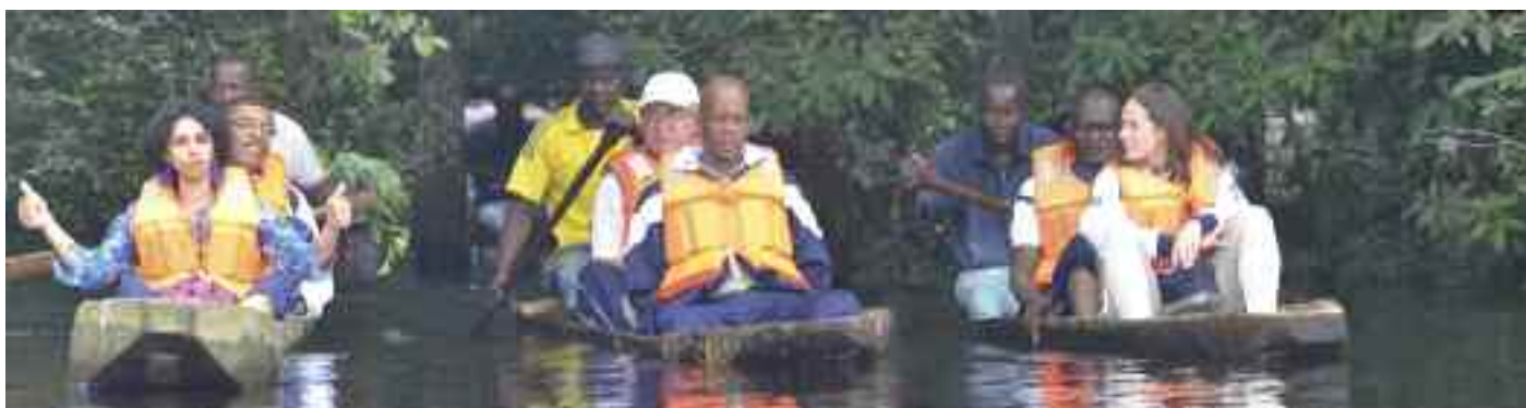
Sur les eaux noires du Nyong