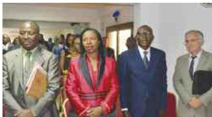
Quelques invités de marques