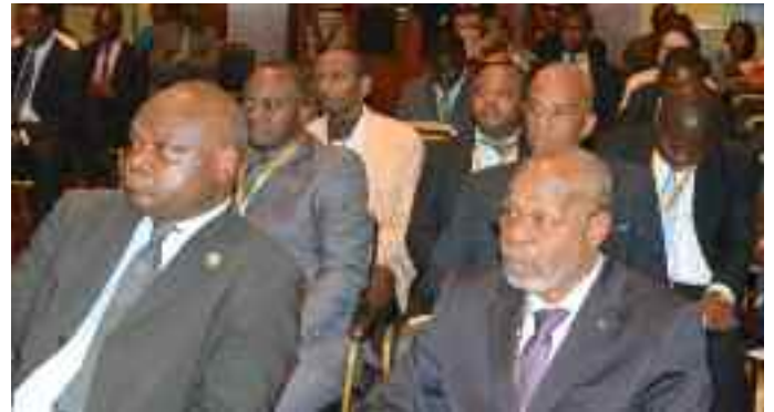
Une vue des différents experts africains invités