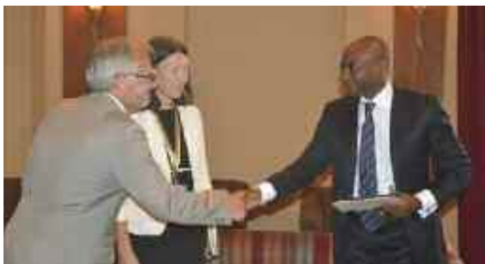
La délégation française et le SG/MINFI