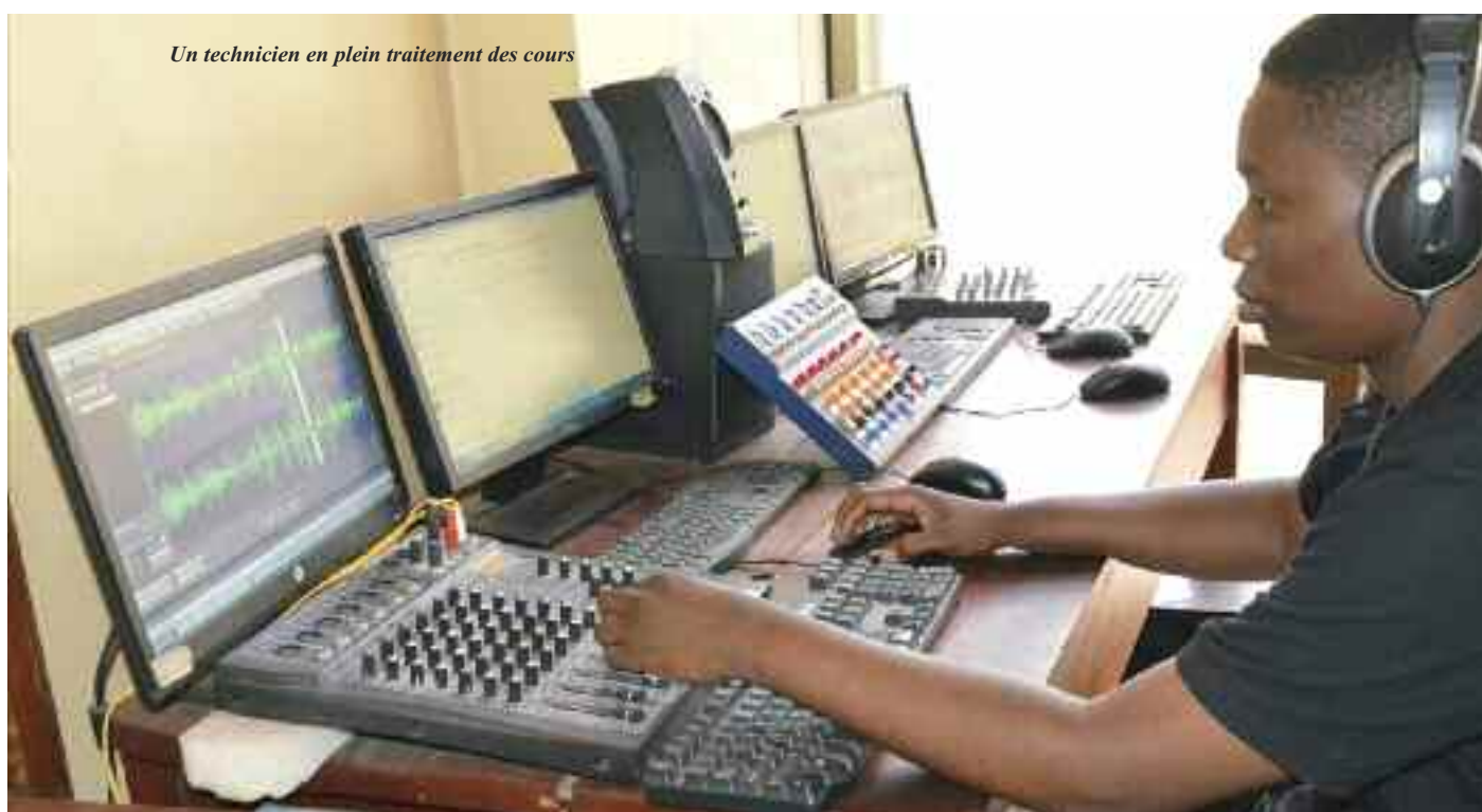
Un technicien en plein traitement des cours

exploiter et explorer de manière optimale les contenus qui alimentent les différents modules de cours. L'originalité de l'offre de la formation à distance du PSSFP se retrouve dans la possibilité de retracer les parcours des auditeurs et des enseignants dans les plateformes avec même la possibilité de les matérialiser par la production des statistiques relatives aux différentes activités de chacun. La formation à distance constitue à l'heure actuelle un des axes majeurs de l'innovation du PSSFP. Cette situation ouvre, ici, à un enjeu économique et socio professionnel qui permet d'accroître la capacité d'accueil des apprenants en Finances Publiques pour une même promotion.