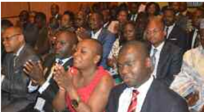
Satisfaction des participants