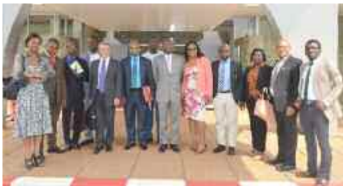
Séminaire de renforcement des capacités des responsables des programmes des départements ministériels sur le pilotage par la performance. Photo de famille