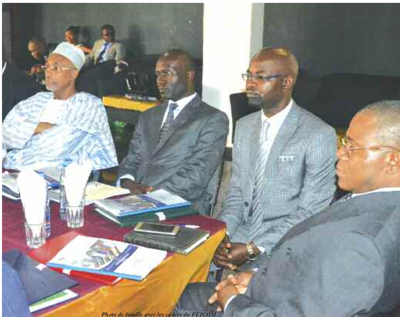
Photo de famille avec les cadres du FEICOM

Ces conférences sont animées par les hauts responsables, les experts nationaux et internationaux.