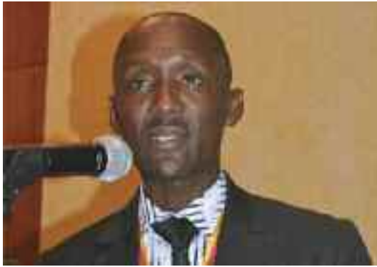
Le rapporteur général