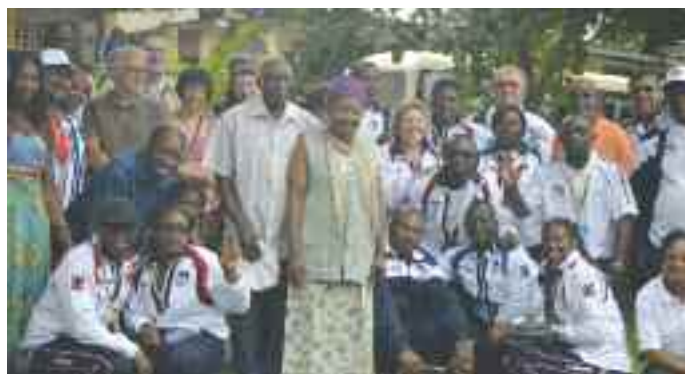
Escale à Nsimalen