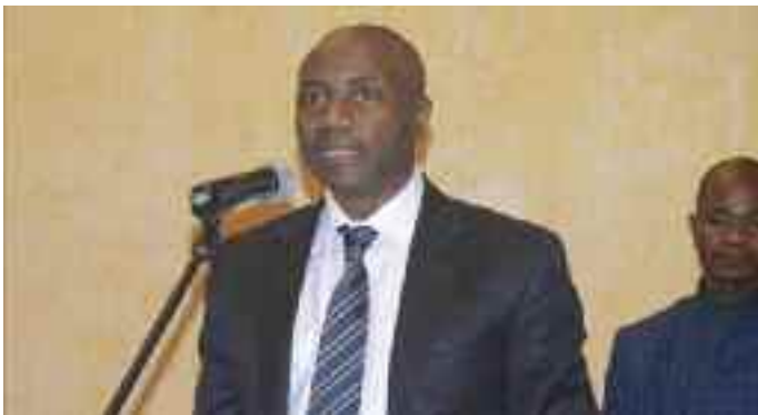
Discours de clôture du SG/MINFI