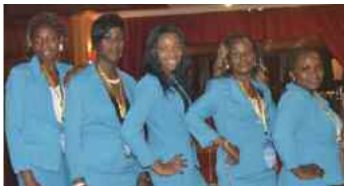
Attitude des cadres féminins du PSSFP