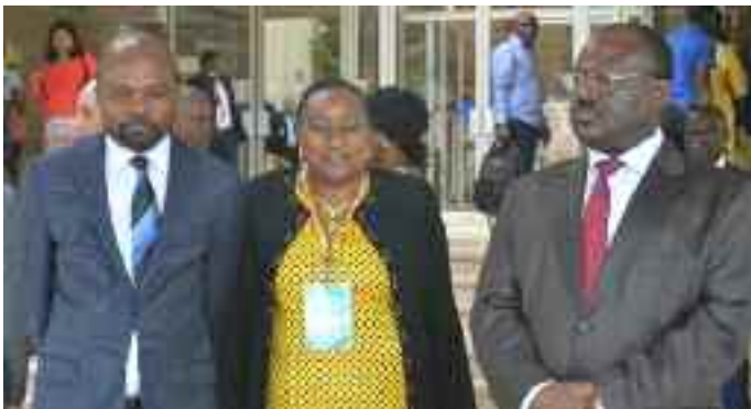
Mise en place des personnalités