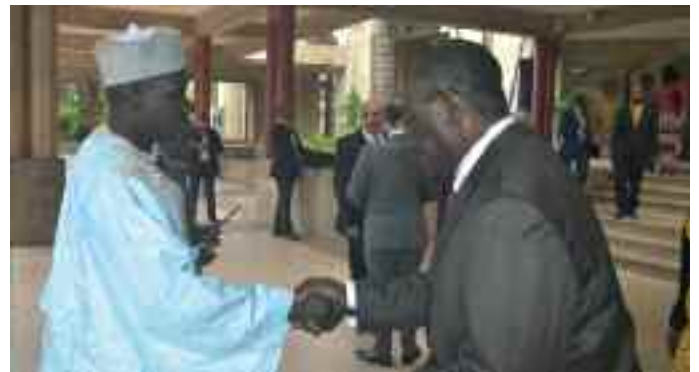
Accueil du MINFI par le DGTCFM