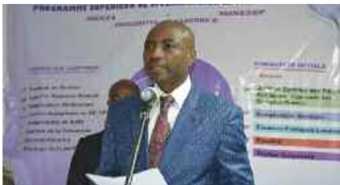
M. le SG du MINFI lors de son allocution