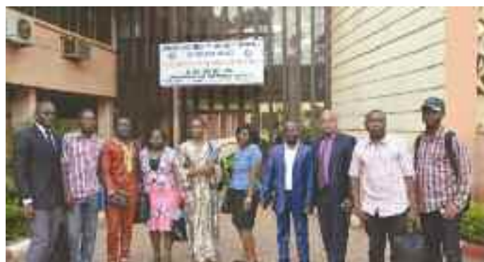
Répondant à une invitation du FMI