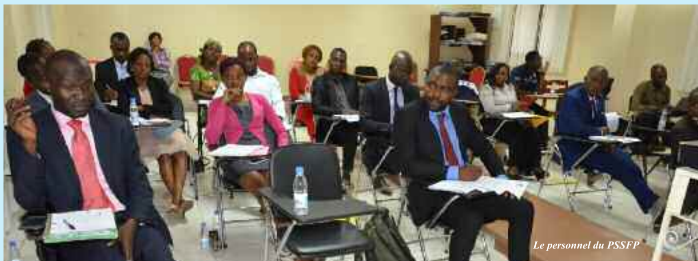
Le personnel du PSSFP

« Le PSSFP, le rêve de l'émergence du Cameroun ».