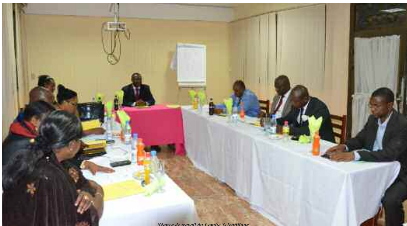
Séance de travail du Comité Scientifique