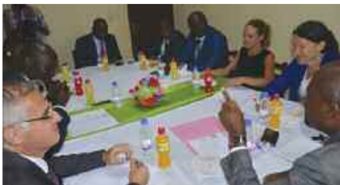
Séance de travail avec Expertise-France