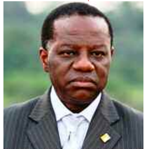
Jacques FAME NDONGO Ministre de l'Enseignement Supérieur