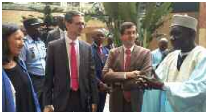
Le Ministre des Finances et l'Ambassadeur de France à l'issue de la Conférence des Instituts des Finances Publiques