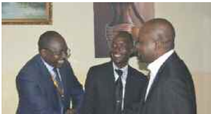
Arrivée du PCP