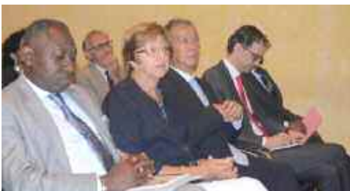
Le SG du MINEPAT, la représentante résidente de l'Union Européenne au Cameroun et l'Ambassadeur du Japon au Cameroun