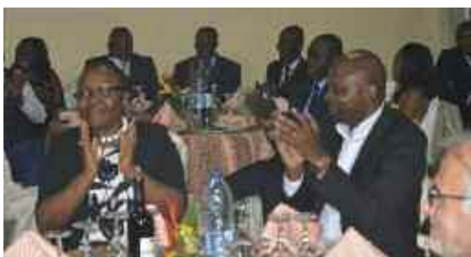
Satisfaction du représentant du MINFI