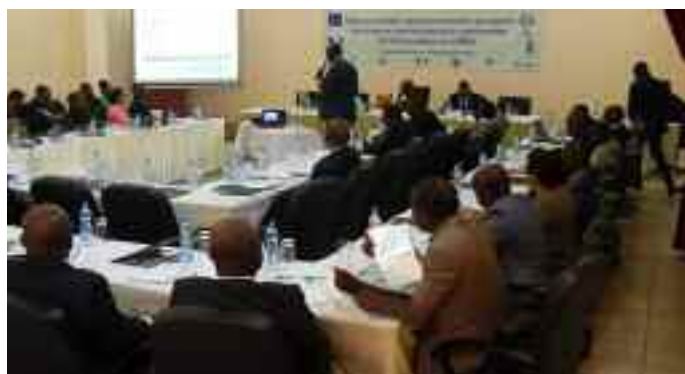
Participation du PSSFP à l'atelier CEMAC de validation des modules à Libreville (Gabon)