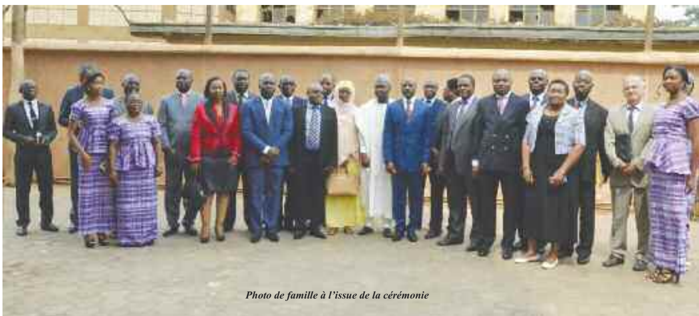
Photo de famille à l'issue de la cérémonie