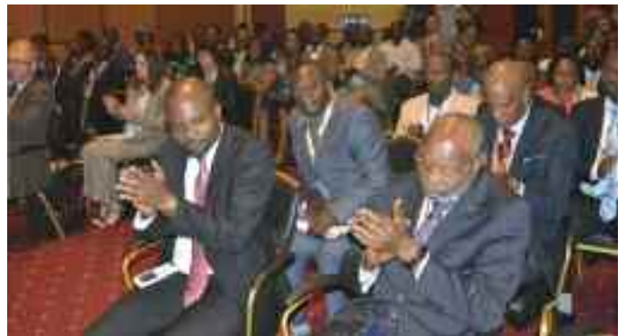
Satisfaction des participants