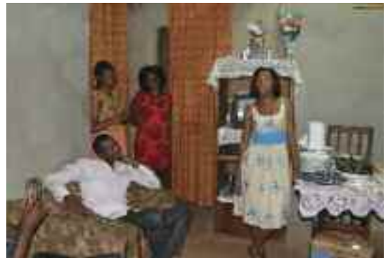
Assemblée Générale chez un membre

Elle doit par ailleurs continuer à entretenir des liens de fraternité si nécessaire à la vie associative et au sein même de la structure qu'est le PSSFP.