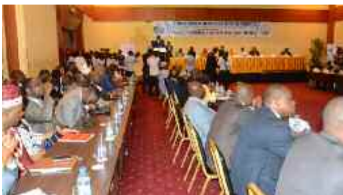
Comité Interministériel d'Examen des Programme (CIEP)

Les auditeurs ont également assisté à la présentation du Fonds Monétaire International (FMI), à la Conférence des instituts des Finances Publiques du 28 au 29 octobre 2016 au Hilton Hôtel, au lancement de l'emprunt obligataire de l'État du Cameroun 2016-2021 au 5,5%, aux travaux en plénière à l'hémicycle de l'Assemblée nationale lors de la session budgétaire de novembre 2016.