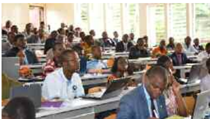
La présentation du Fonds Monétaire International (FMI)