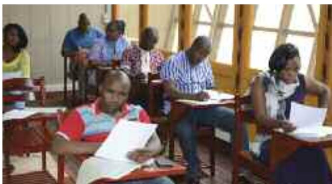
Des auditeurs en séance d'évaluation ( Finances Publiques Locales )