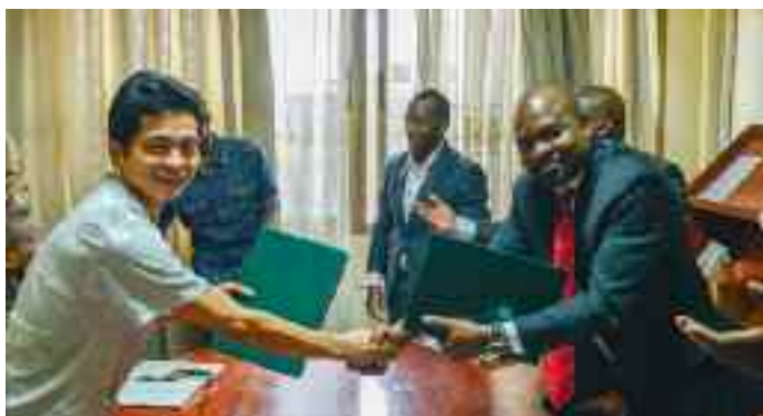
Echanges de civilités avec le Directeur de Confucius