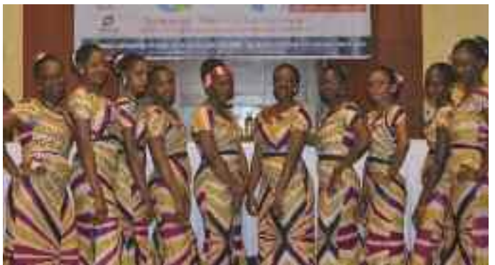
Attitude des hôtesse de la Conférence