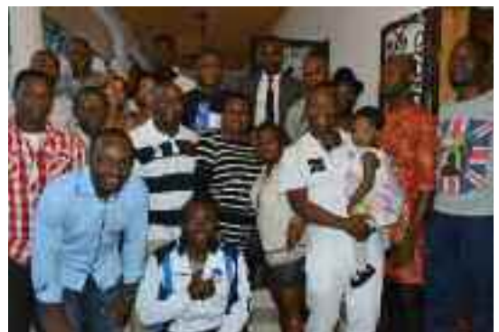
Visite au nouveau-né chez un membre