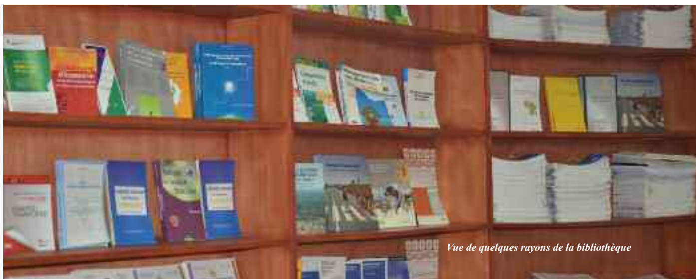
Vue de quelques rayons de la bibliothèque

C réée au début de l'année 2016, le centre de documentation du PSSFP s'est doté d'outils ultra modernes à travers des applications nouvelles qu'il intègre dans ses utilisations quotidiennes.