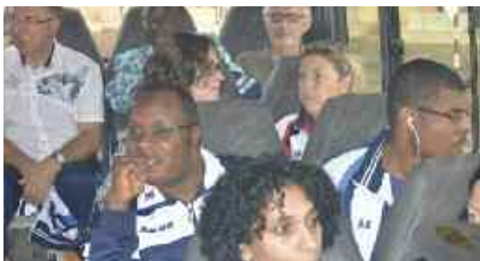
En route pour Ebogo