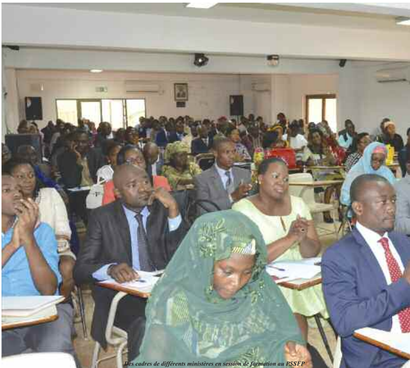
Des cadres de différents ministères en session de formation au PSSFP

Issu de la convention tripartite signée le 09 octobre 2013 entre le Ministère des Finances, le Ministère de l'Enseignement Supérieur et l'Université de Yaoundé II-Soa, le PSSFP est la première phase de mise en place d'un Institut Supérieur en Finances Publiques au Cameroun.