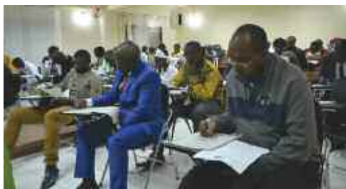
Des auditeurs en séance d'évaluation ( Tronc commun )

Dans la perspective d'un déploiement international, le Ministre des Finances a signé une convention de partenariat avec Expertise-France le 19 décembre 2014 "pour la mise en place d'une coopération technique au profit de l'Institut Supérieur des Finances Publiques du Cameroun (ISFP)"; ce qui a permis à six auditeurs d'effectuer les stages professionnels au sein des administrations publiques françaises. Les trois promotions en cours de formation comptent 400 auditeurs.