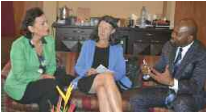
Séance de travail avec la représentante résidente du PNUD au Cameroun