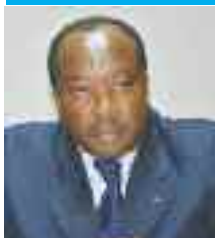
Pr. TAMBA Isaac