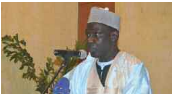
Discours d'ouverture du MINFI