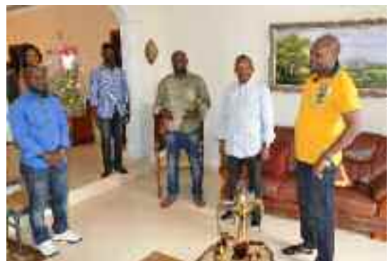
Visite chez un membre