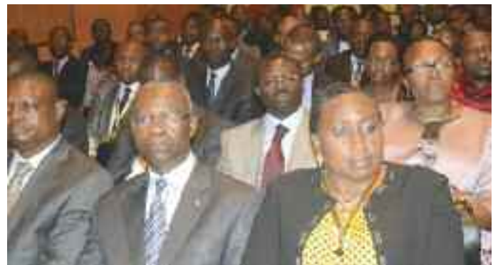
Une vues des hautes personnalités conviées