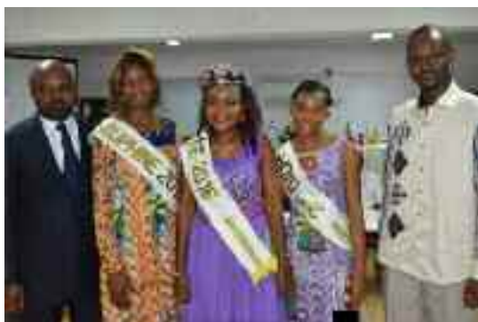
08 mars, les femmes à l'honneur