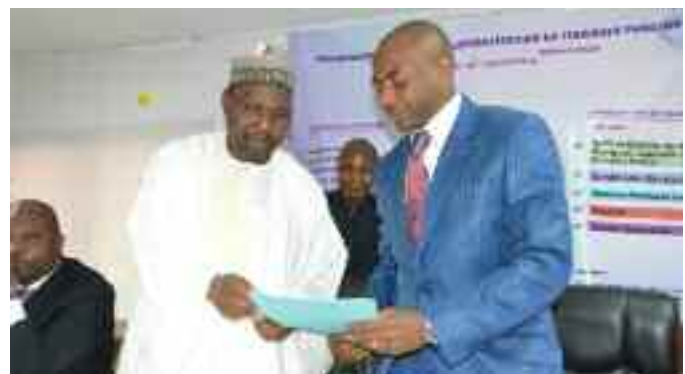
Le Recteur et le SG