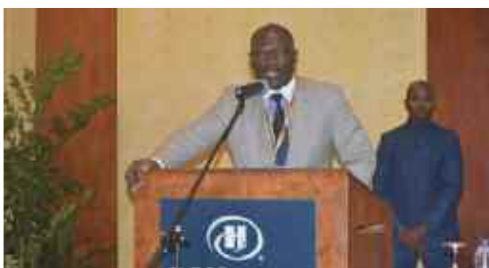
Le Master of ceremony