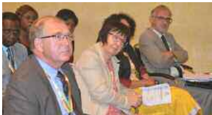
La délégation française