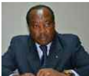
Pr TAMBA Isaac DGE MINEPAT