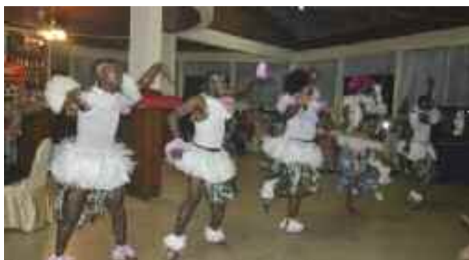
Le groupe Omalo était de la partie