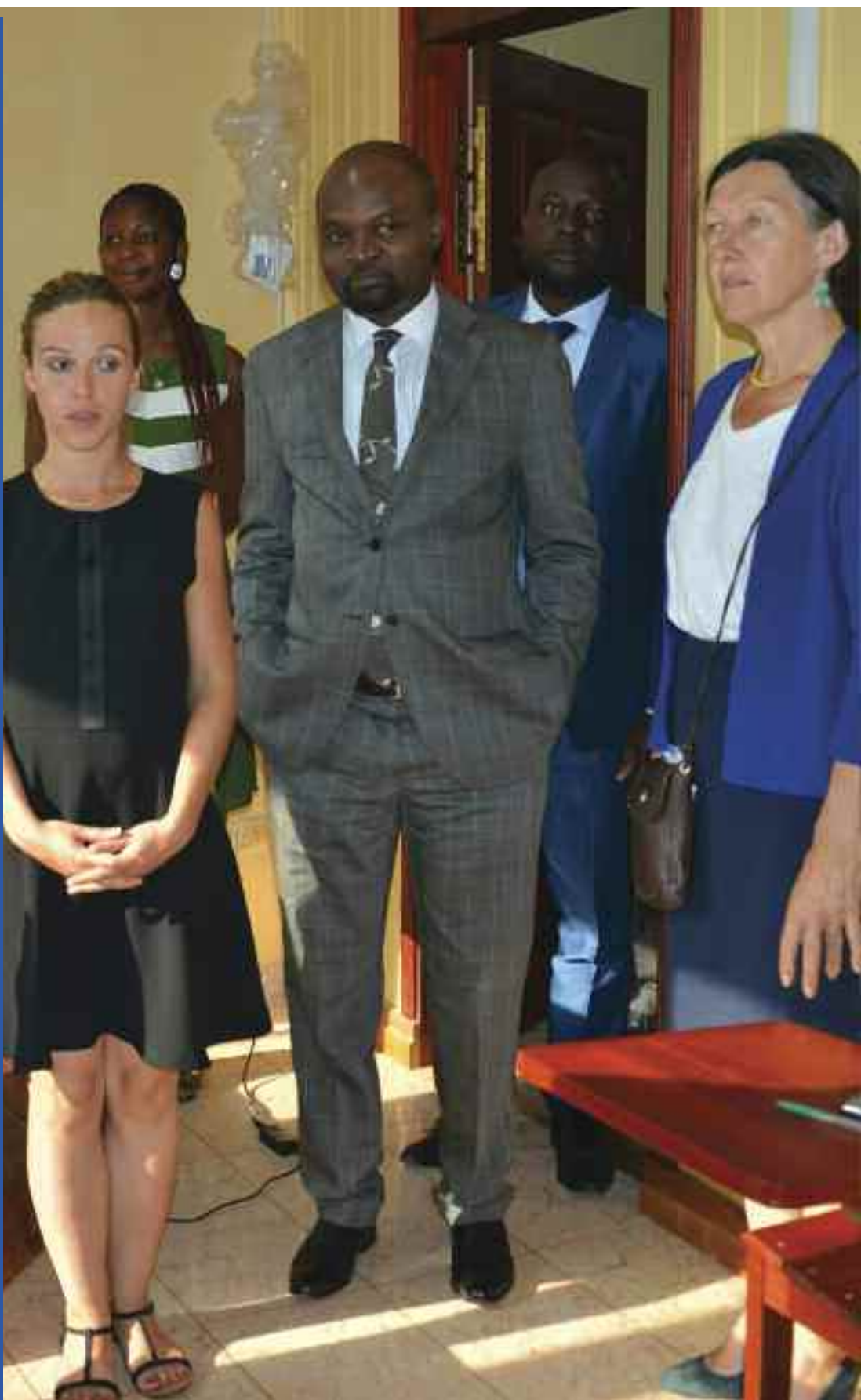
Le Président du Comité de Pilotage en compagnie d'une délégation d'Expertise France