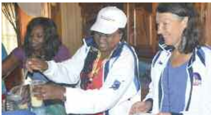
Convivialités à Nsimalen