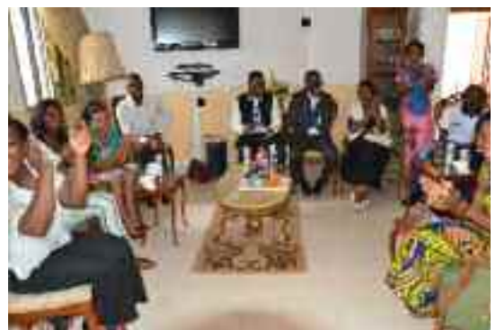
Moment de détente au sein de l'amicale