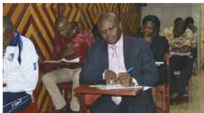
Des auditeurs en séance d'évaluation ( Tronc commun rattrapage )