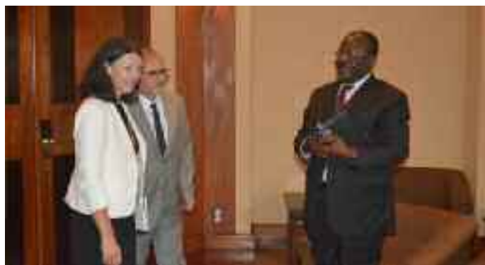
La délégation française et le DGTCFM