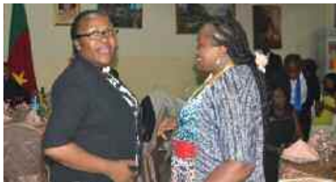
Accueil de Mme Yecke représentante du MINFI