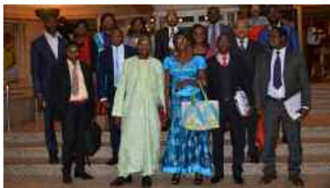
Photo de famille à l'issue du comité