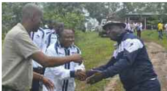
Accueil des invités