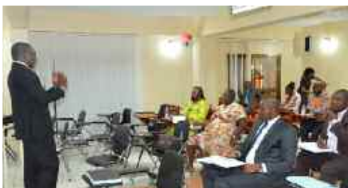
Une vue des participants à la formation des journalistes