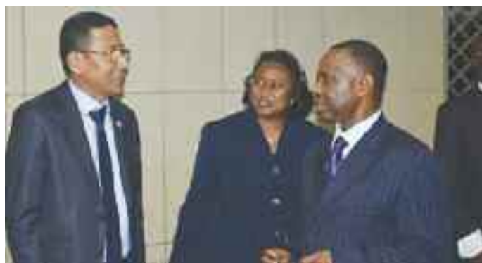
Visite d'une délégation du PNUD