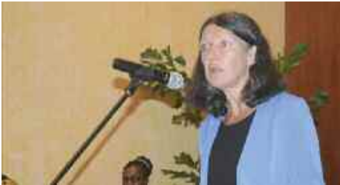
Allocution de Mme Loyer