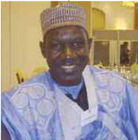
ALAMINE OUSMANE MEY Ministre des Finances