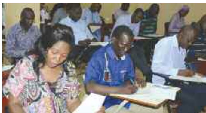
Des auditeurs en séance d'évaluation ( Gestion Budgétaire )