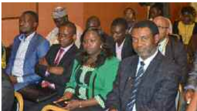
Conférence des instituts des Finances Publiques