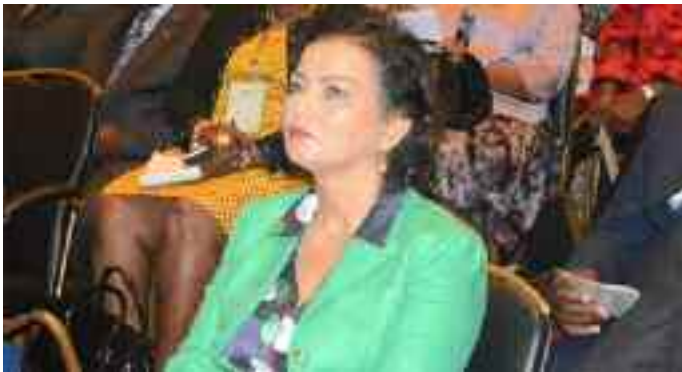
La représentante du PNUD au Cameroun