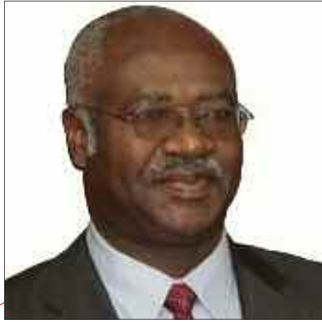
Philemon YANG Premier Ministre, Chef du Gouvernement