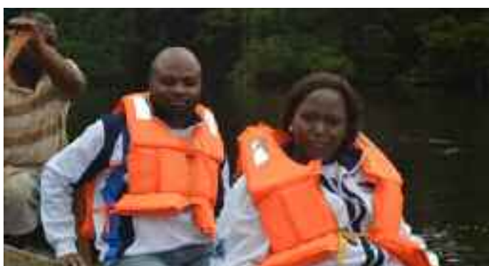
Le PCP très détendu