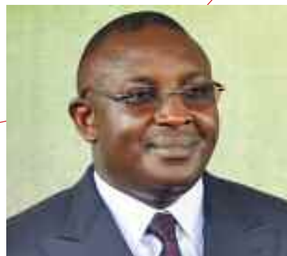
ELUNG Paul CHE Ministre Délégué auprès du Ministre des Finances