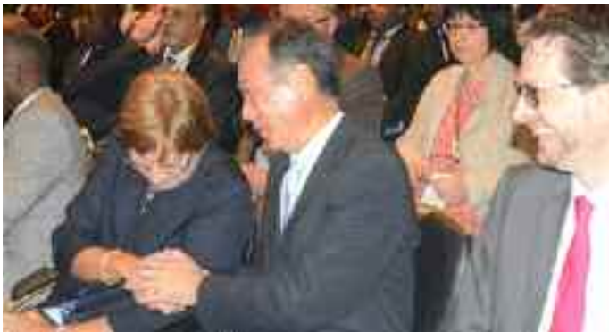
L'ambassadeur du Japon au Cameroun