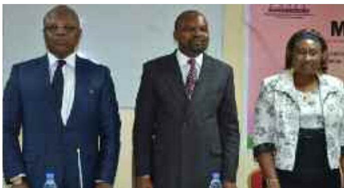
Remise d'un don de manuels par la CEMAC