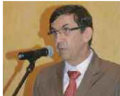
Allocution de l'Ambassadeur de France au Cameroun