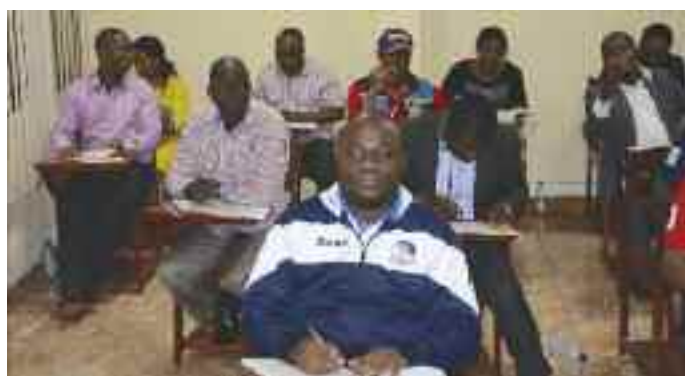
Des auditeurs en séance d'évaluation ( Comptabilité Publique )